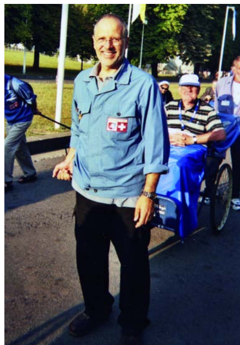
Intensa l'attività di volontariato in seno alla parrocchia di Balerna e a diverse associazioni, come pure al servizio degli ammalati e degli anziani