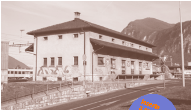
L'edificio ex Foft come si presenta ora.

Nell'ottobre del 1998, il Municipio costituì la Commissione giovani, alle dipendenze del Dicastero museo e cultura con il compito di fronteggiare le esi-