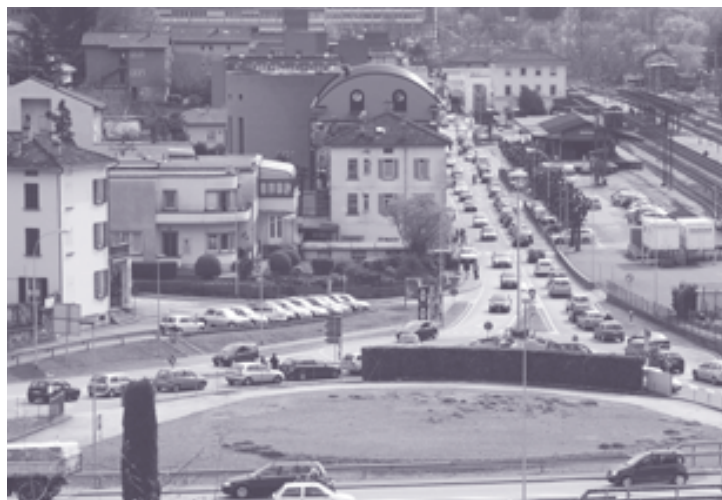
Via Franscini verrà sgravata dal traffico in transito, dirottato sulla futura strada cantonale (l'attuale tratto di superstrada).